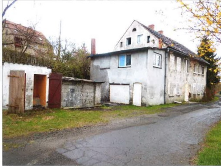
Ogólny widok nieruchomości.

Pierwszy przetarg ustny nieograniczony na sprzedaż przedmiotowej nieruchomości został przeprowadzony w dniu 23 września 2022 roku zgodnie z ogłoszeniem z dnia 25 lipca 2022 roku i zakończył się wynikiem negatywnym z uwagi na brak osób zainteresowanych.